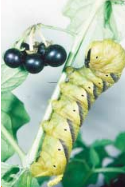
Cette belle chenille est celle du Sphinx tête-de-mort. La découvrir demeure un plaisir rare dans notre pays, surtout dans les départements septentrionaux. 1956 restera comme l'une des années les plus favorables à la migration de ce Sphinx en Europe.

Jusque là, l'étude ne concernait qu'une seule espèce (le Vulcain) et