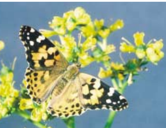
La Belle Dame est un vrai migrateur originaire d'Afrique du Nord. Sa migration annuelle en Europe est plus ou moins massive selon les années. La dernière grande invasion en France remonte à 1996.

jusqu'aux îles Shetland ou en Islande, soit ils longent la côte méditerranéenne, empruntent la vallée du Rhône puis celle de la Saône, jusqu'aux Pays-Bas. Dans les deux cas, les papillons arrivés dans le Sud de l'Angleterre ou en Belgique peuvent poursuivre vers les côtes danoises puis la Scandinavie, notamment la Norvège, et atteindre le cercle polaire arctique.