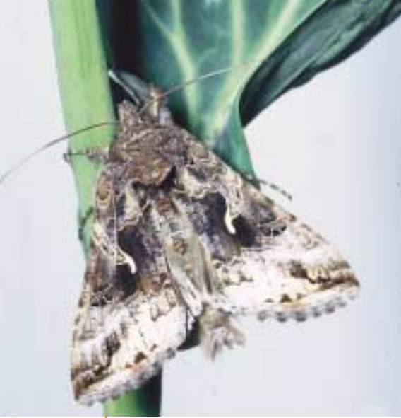
Le Gamma est un vrai migrateur qui arrive tous les ans en Europe en grand nombre. Cette Noctuelle peut être observée de jour, au crépuscule et de nuit.