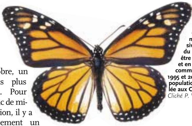
Le Monarque, célèbre pour ses migrations massives en Amérique du Nord, peut parfois être observé en France et en Angleterre, comme ce fut le cas en 1995 et 2001. Il existe une population indigène installée aux Canaries.

octobre, un mois plus tard. Pour le pic de migration, il y a également un mois de décalage entre