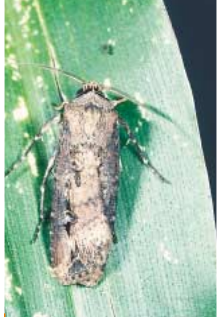
La Noctuelle baignée effectue une migration vers le nord au début de septembre. Sa descendance est observée en octobre, parfois jusqu'en décembre. Cette migration tardive en saison vers le nord peut s'expliquer par le fait que le papillon se place ainsi dans les conditions météorologiques les plus favorables à sa reproduction.